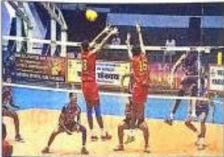
वीएचएफ के इंडोर स्टेडियम में केरल और आंध्र के बीच खेले गये मैच का दृश्य।