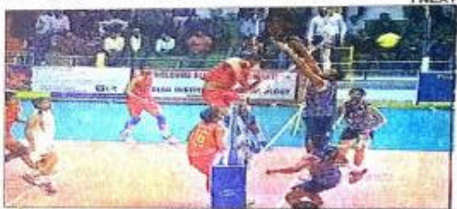
फेडरेशन कप वॉलीबॉल के एक मैच का दृश्य।